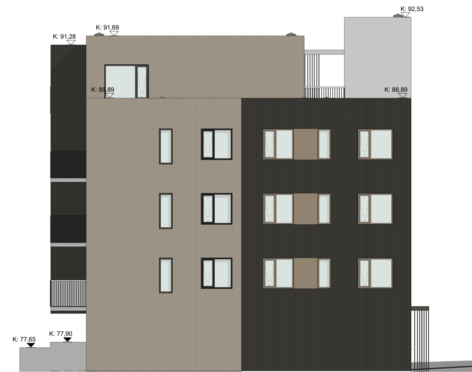
1 ÚTLIT AUSTUR 1 : 100