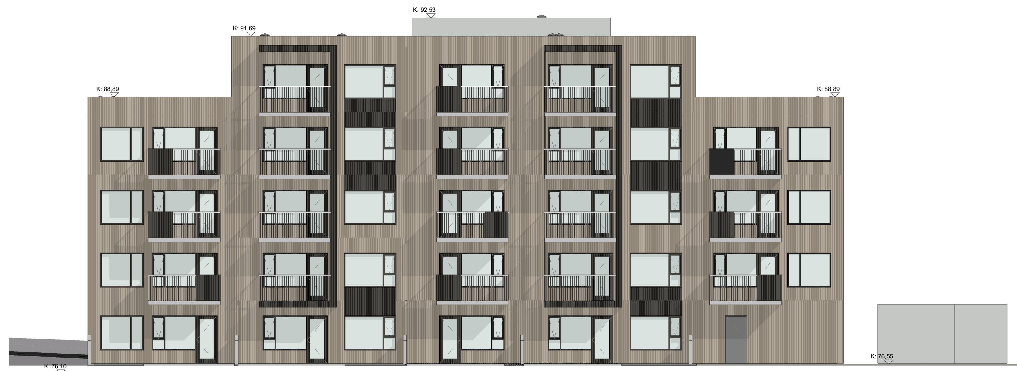
3 ÚTLIT SUÐUR 1 : 100