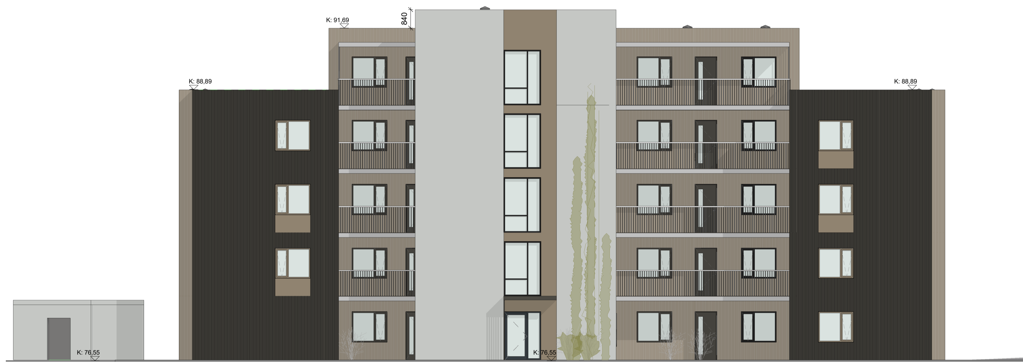
2 ÚTLIT NORÐUR 1 : 100